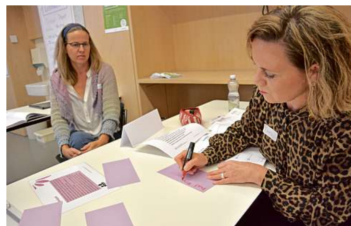
Lebhaftes Auseinandersetzung: In Kleingruppen befassen sich die Kursteilnehmenden mit einzelnen Aspekten von psychischen Störungen, es werden Notizen gemacht und ins Plenum getragen, und auch Rollenspiele (Foto unten links) beleben den Kursabend.